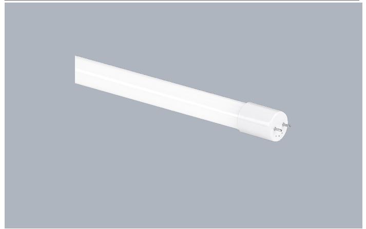
20W 1200mm T8 Frosted LED Röhre