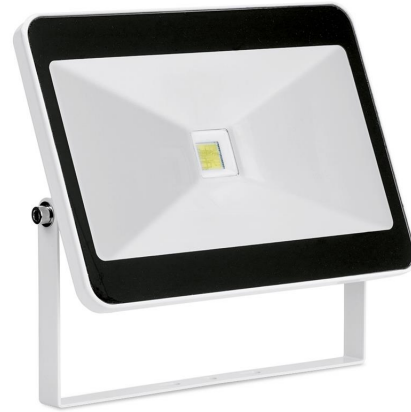
Quazar™ Projecteur Extérieur LED 50W 180-240V IP65