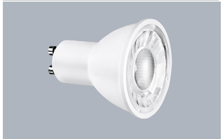
GU10 5W LED Leuchtmittel Dimmbar