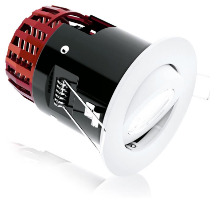
M7™ 6W IP65 SCHWENK- UND DIMMBARES FIRE RATED DOWNLIGHT