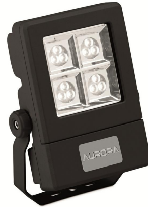
25W IP65 Adjustable 33° Floodlight